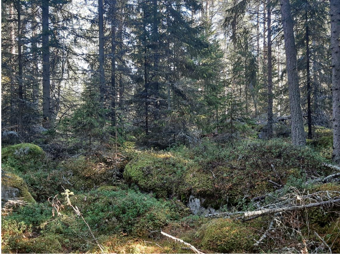
Bild 3. På fastighetens steniga mark växer en tvinväxt, gammal granskog med inslag av tallar.