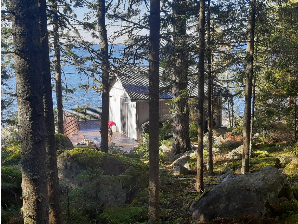
Bild 5. Fastigheten sedd från öster mot havet i nordväst.