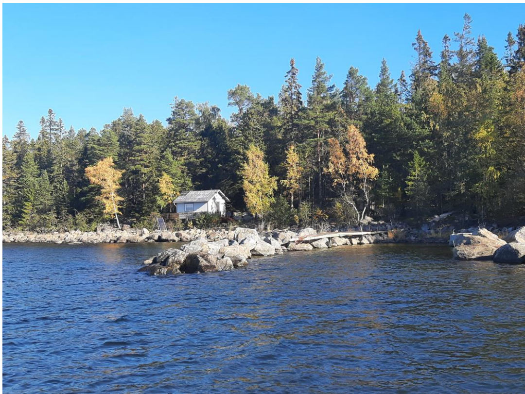
Bild 4. På fastigheten finns en mindre fritidsbyggnad samt en bra, delvis naturlig båthamn.