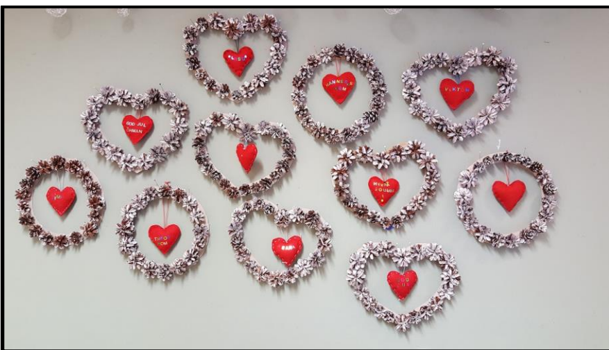
Suloiset ovikranssit kävyistä. (3.-4.lk.)