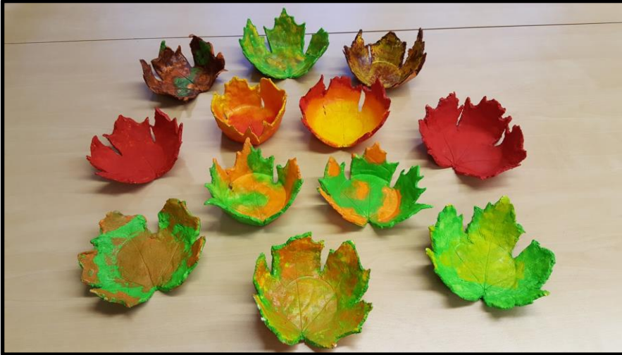
Vaahteranlehtikippoja askarrettiin 4.-6.-luokkalaisten kanssa.