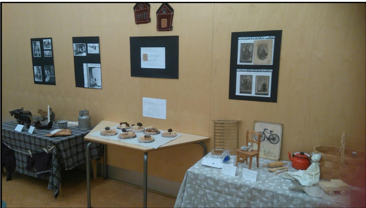
Maaliskuussa tutustuimme entisaikojen lasten elämään pienen näyttelyn avulla. Esikoululaiset tekivät käpylehmiä ja hirsikehikoita.