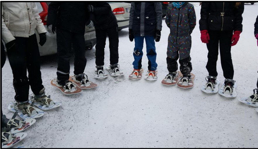
Lähdössä lumikenkäretkelle metsään. (4.-6.-lk.)